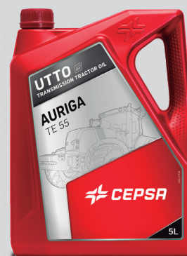
Gama Transmisiones, Industria y Agrícola: rojo