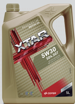
Gama XTAR: dorado