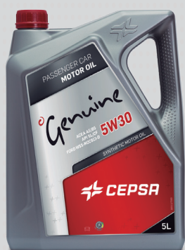
Gama Moto, Genuine y Avant: plata

de Cepsa, permitiendo el reconocimiento rápido del producto por el usuario y su diferenciación con el resto de fabricantes.